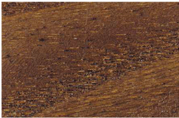
6003 Açık Ceviz / Clear Walnut / Светлый орех