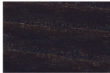
4002 Abanoz / Ebony / Черное дерево