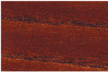
6002 Kızıl Kahve / Red Brown / Красный Браун