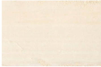
1000 Beyaz / White / Белый