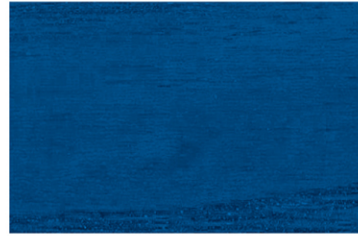
4001 Mavi / Blue / синий