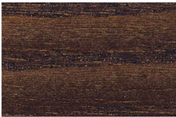
6000 Klasik Ceviz / Clasic Walnut Классический Уолнат