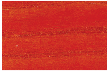
3004 Kırmızı / Red / Красный