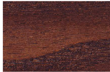
6004 Mango Kahve / Mango Brown / Манго кофе