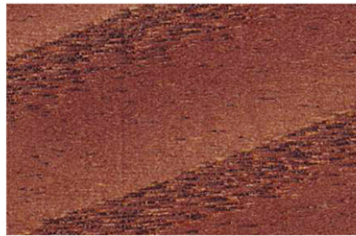
3002 Maun / Mahogany / Красное дерево