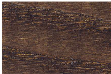
6001 Antik / Antique / Античный