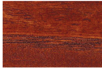
3001 Armut / Pear / Груша