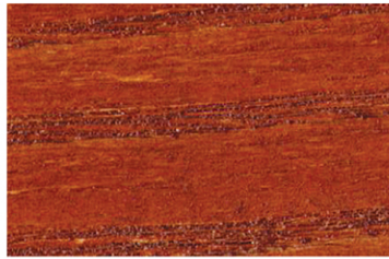
3000 Kiraz / Cherry / Черри