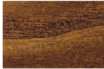
3005 Burma / Burma / Выжимать