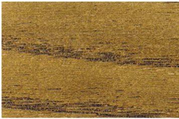
6005 Rustik Ceviz / Rustic Walnut / Сельский Уолнат