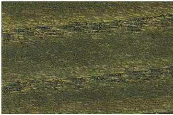
5000 Jade / Jade / Нефрит