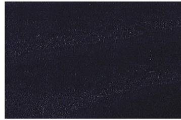
4000 Venge / Venge / Венге